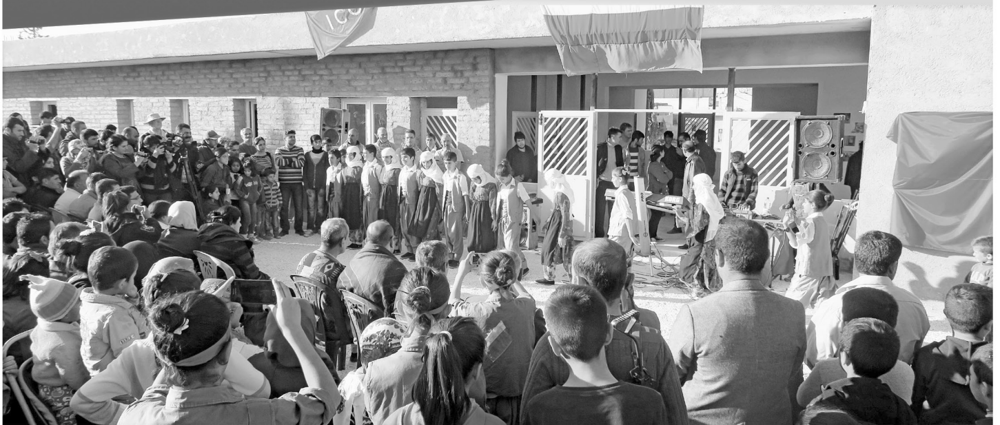
Feier zur Übergabe des Gesundheitszentrums an die Selbstverwaltungsorgane in Kobanê am 20.11.2015

Die türkische Regierung droht mit massiven Militärschlägen gegen die kurdische Befreiungsbewegung und die kurdische Bevölkerung in Rojava/Nordsyrien. Erste Luftangriffe gegen kurdische Gebiete im Nordirak werden schon geflogen. Seit Monaten geht das türkische Militär unter Präsident Erdoğan wieder mit offenem Staatsterror gegen fortschrittliche und revolutionäre Kräfte in der Türkei und die kurdische Zivilbevölkerung vor. In Rojava machen die demokratischen Kräfte um die Volksverteidigungseinheiten YPG und Frauenverteidigungseinheiten YPJ große Geländegewinne mit dem Ziel der Verbindung der drei Kantone Rojavas. Um das zu verhindern und dem kurdischen Befreiungskampf eine Niederlage beizubringen, droht Erdoğan seit Wochen mit einem Einmarsch in Rojava .