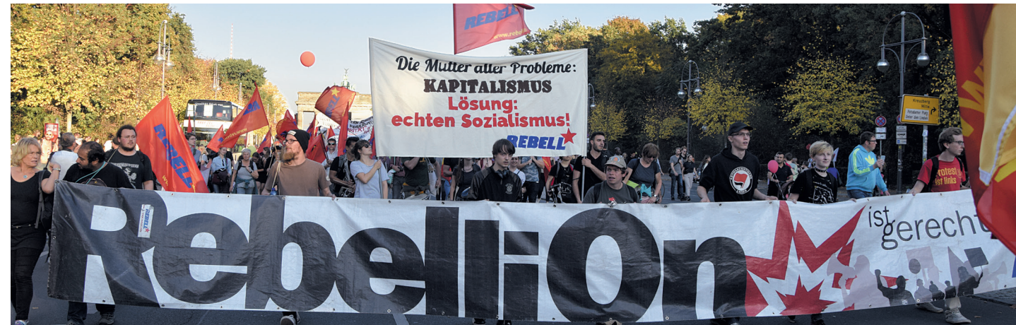
Mit ihrem Jugendverband REBELL organisiert die MLPD die Rebellion der Jugend – und nimmt die Mutter aller Probleme ins Visier

– unisono erheben sie die Forderung nach antikomunistischer Ausgrenzung. Am Tag nach der Demonstration #unteilbar gibt Bild die Losung aus „Teilt euch!“ aus, als Auftakt einer dann folgenden Artikelserie, und sie fordert den Ausschluss angeblicher „Extremisten“ und „Antisemiten“. Wer konsequent die Rechtsentwicklung der Bundesregierung bekämpft, wird zum Extremisten erklärt. Wer – mit vielen Israelis gemeinsam – die faschistoide Politik der Netanjahu-Regierung kritisiert, wird als „antisemitisch“ diffamiert. Absurde Anschuldigungen werden ins Feld geführt: Verwerflich ist schon das von der demokratischen Bewegung hart erkämpfte Recht, Flaggen und Symbole zu zeigen, wahrzunehmen oder Kundgebungen und Informationsstände durchzuführen. Sollen hier Zustände wie in Ungarn oder Polen eingeführt werden, wo kommunistische Flaggen und Symbole verboten sind und rigoros unterdrückt werden?