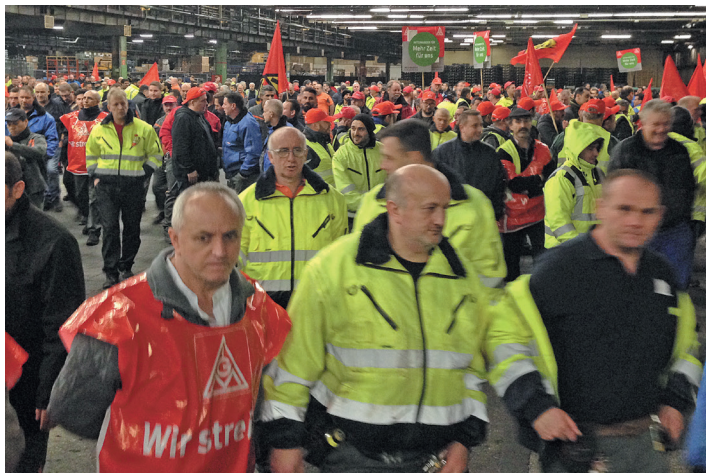
1,2 Millionen Arbeiter in gewerkschaftlichen Tarfkämpfen sind der Ausgangspunkt der kämpferischen Entwicklung (Warnstreik bei Ford Köln)

Bandbreite der Teilnehmerinnen und Teilnehmer – die TAZ formuliert treffend: „Von der Kirche bis zur MLPD“.