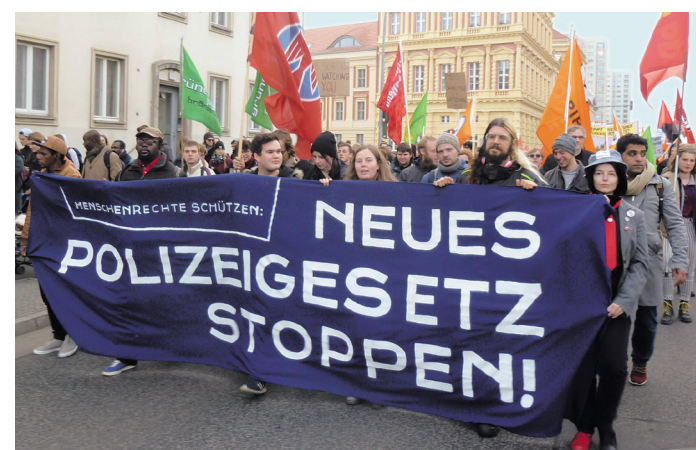
Tatsächlich unteilbar und gleichberechtigt – das Brandenburger Bündnis #noPolBbg bei der Demonstration in Potsdam am 11. November

Programm der Marxistisch-Leninistischen Partei Deutschlands farbig, mit vielen Bildern, Format DIN A6 Selbstkostenpreis: 1,00 Euro Bestellungen an: Verlag Neuer Weg Alte Bottroper Str. 42, 45356 Essen Telefon: 0201 25915 E-Mail: vertrieb@neuerweg.de