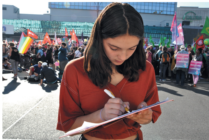
Viele zeigten ihre Flaggen – und viele folgten dem Aufruf zur organisierten Zusammenarbeit und trugen sich in die Liste des Internationalistischen Bündnisses ein

schluss von Marxisten-Leninisten die Chancen auf eine künftige rot-rot-grüne Regierung verbessert werden? Warum sollte das von Interesse sein für die fortschrittliche Bewegung gegen die Rechtsentwicklung der Regierung, wo wir genau wissen, dass die rot-grüne Bundesregierung Kriegseinsätze der Bundeswehr, die Hartz-Gesetze usw. zu verantworten hat? Versprechen sich solche Akteure Posten oder Vorteile, wenn sie vorher die Dreckarbeit gegen die MLPD machen? Einen fortschrittlichen Nutzen im Sinne der Bewegung hat das Vorgehen dieser Leute auf jeden Fall nicht!