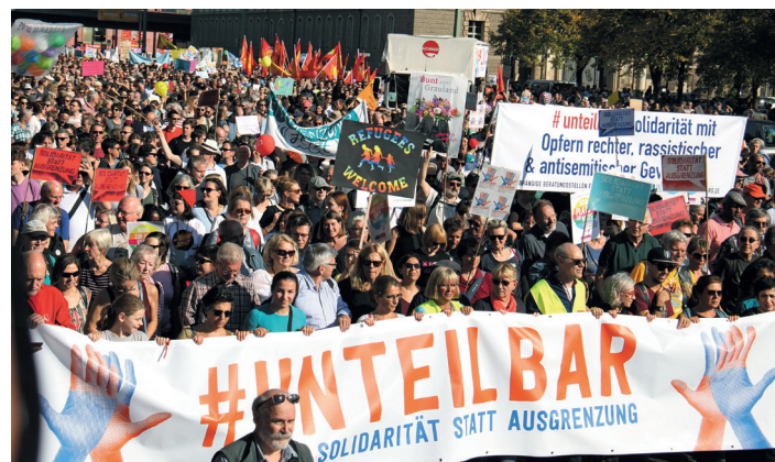
#unteilbar, 13. Oktober in Berlin: Fast eine Viertel Million gegen die Rechtsentwicklung der Regierung – und die Bandbreite von Religion bis MLPD

5. Insbesondere die Breite „von Religion bis Revolution“ bringt die Reaktion in Wallung. Seien es die AfD-Chefs Jörg Meuthen oder Björn Höcke, die FDP, der Bund deutscher Kriminalbeamter oder die Bild -Zeitung