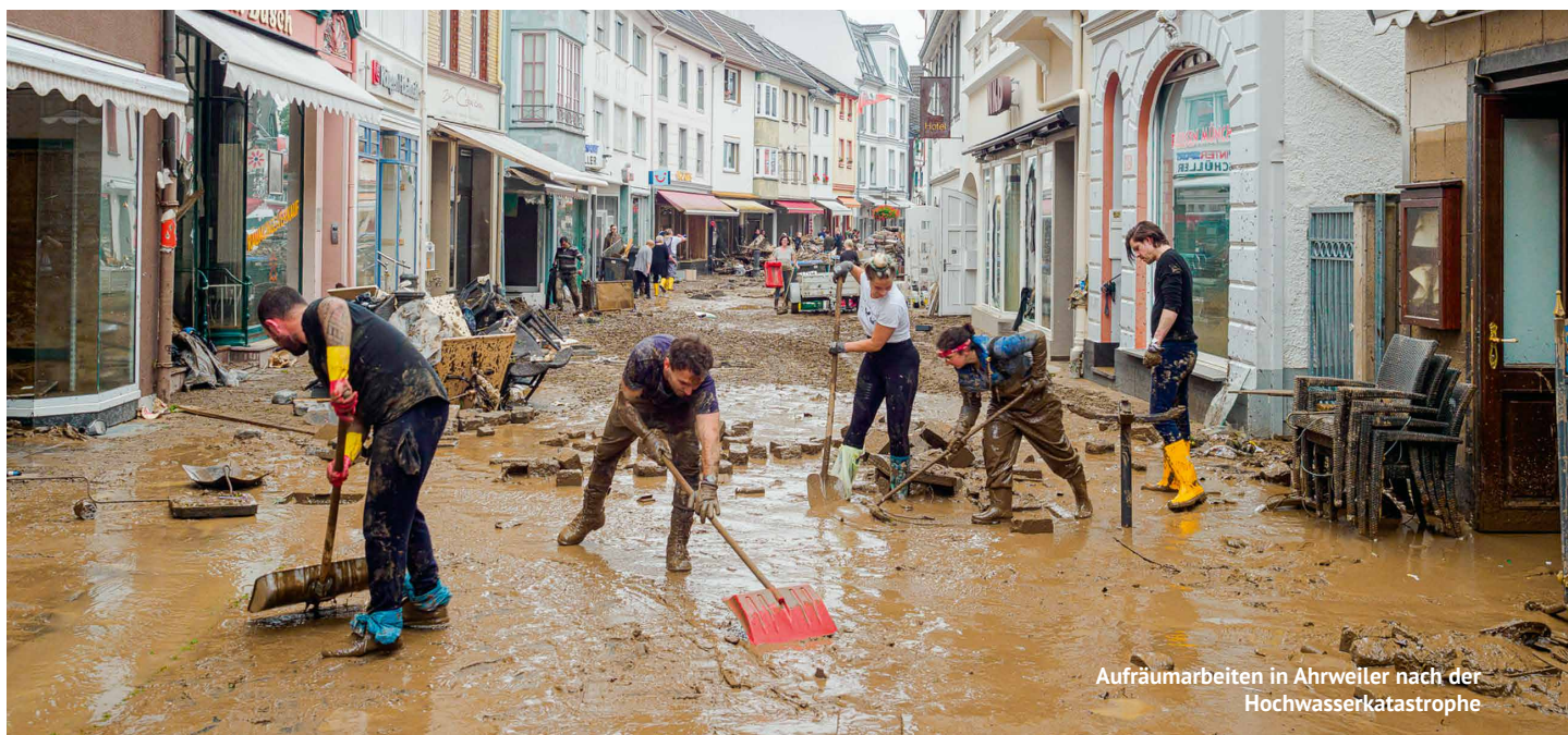
Aufräumarbeiten in Ahrweiler nach der Hochwasserkatastrophe

Als Folge dieser Krise verursacht – nach dem Ausbruch des SARS-Virus und des MERS – jetzt die noch schwerere Covid-19-Pandemie Chaos im globalen Maßstab, was mit drohenden weiteren verhängnisvollen Viren in der Zukunft die Existenz der Menschheit auf der Erde bedroht. →